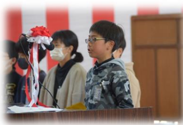
児童会長の歓迎の言葉