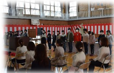
6年生から校歌のプレゼント