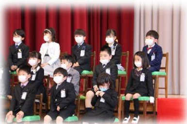
大きな声で返事ができました

4月8日（水）の入学式は、例年と内容を変更しての開催となりました。33人の1年生は、大きな声でしっかりと返事をしたり、よい姿勢で話を聞いたりして、立派な態度でした。1年生33人を加え、全校児童142人、元気に新年度の教育活動をスタートしました。