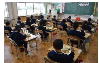
教室での給食の様子

校内の教育活動においても、これまでどおり実施する活動、内容や方法を変更して実施する活動、やむを得ず実施を見送ったり検討したりする活動等に分けて進めてまいります。日々の教育活動も密閉、密集、密接をできる限り排除して行います。特に、毎日の給食は、食堂と教室とに分かれて実施し、一方向を向いて食べるようにしています。いずれにしても、子どもたちの健康と安全を最優先にして、今後の状況を注視しながら教育活動を進めてまいります。地域の皆様、保護者の皆様のご理解とご協力をお願いいたします。